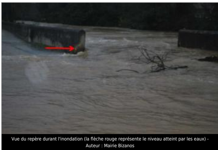
Vue du repère durant l'inondation (la flèche rouge représente le niveau atteint par les eaux)

GÉNÉRAL Code : WEB_R_202201202303 Date de mise à jour : 30/03/2022 Auteur : SMBGP