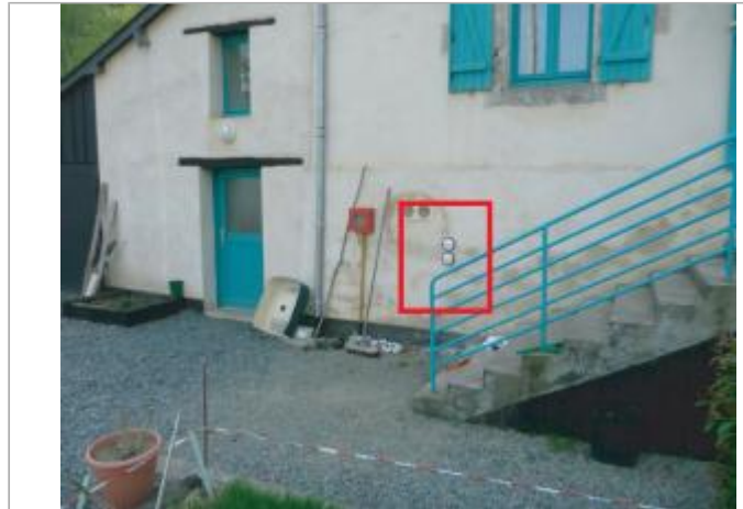
Maison éclusière de la Molière