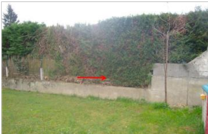
Vue du repère (la flèche rouge représente le niveau atteint par les eaux)