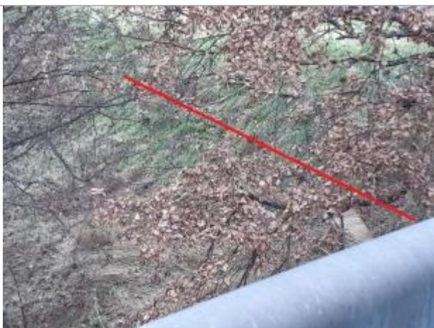
Laisse sur berge rive droite aval de la passerelle

Altitude calculée de l'eau (en m) : 141.35 m