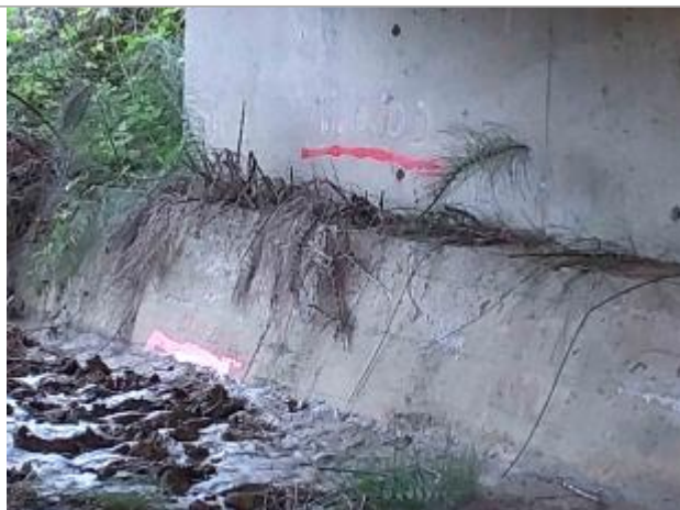
laisse d'inondation sous le pont rive froite