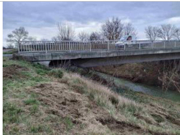
Vu du pont a l'aval rive droite