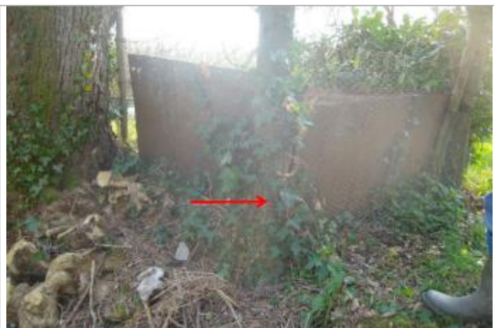
Vue du repère (la flèche rouge représente le niveau atteint par les eaux)

Altitude calculée de l'eau (en m) : 194.07