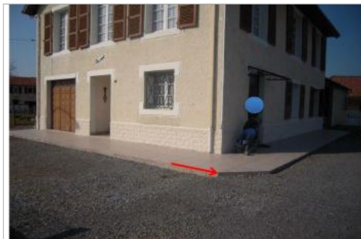
Vue du repère (la flèche rouge représente le niveau atteint par les eaux)

Type de repérage : Campagne de terrain post-inondation