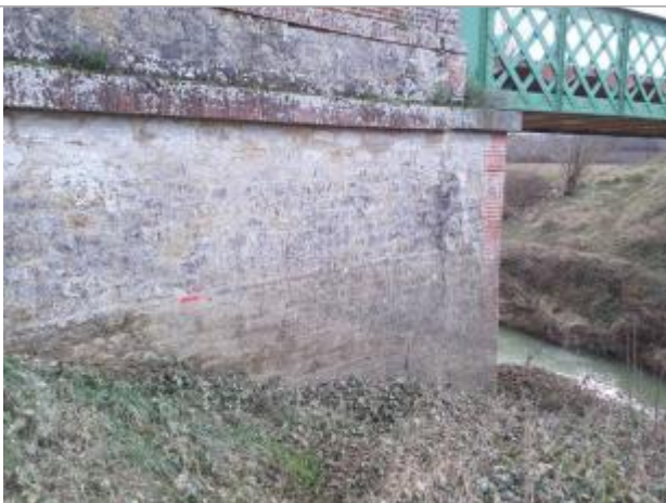
Marque de la crue sur la culée aval du pont en rive droite

Altitude calculée de l'eau (en m) : 151.88