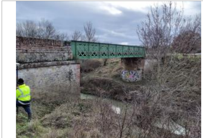
Aval du pont en rive droite

Coordonnées WGS84 : X: 1.55643870 / Y: 43.47936800