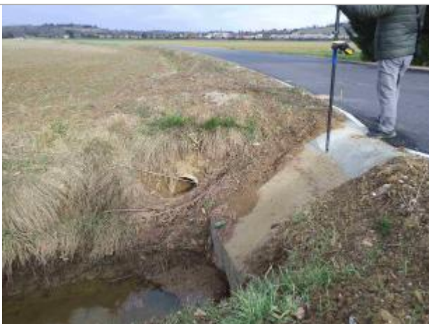
Traces de boues dans le fossé