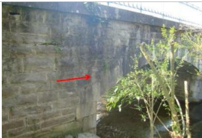
Vue du repère (la flèche rouge représente le niveau atteint par les eaux)

Type de repérage : Campagne de terrain post-inondation