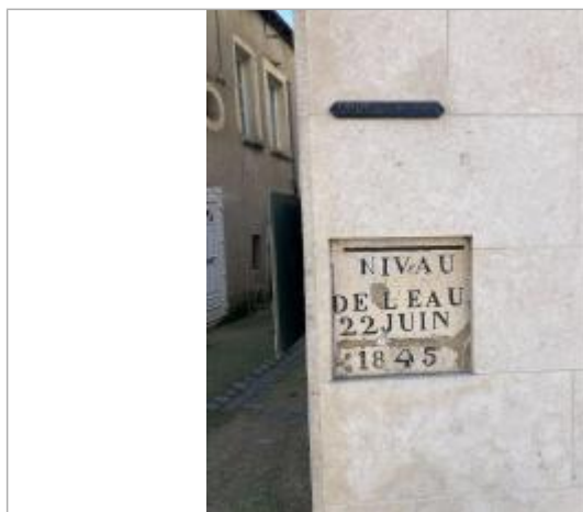
façade de magasin

Organisme : SPC Vienne - Charente - Atlantique