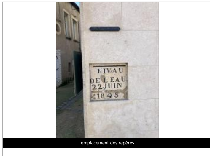
emplacement des repères