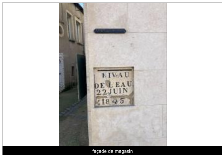
façade de magasin

Texte : NIVeAU DE L'EAU 22 JUIN 1845 Maximum de l'inondation : Oui Visibilité : Oui État du repère : Bon Pérennité : Longue