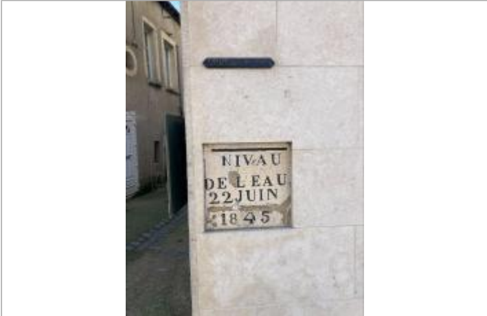
emplacement des repères