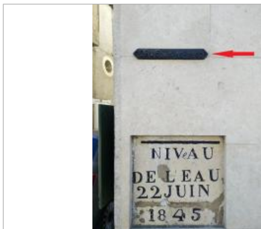
façade de magasin

SOURCE DE REPÉRAGE : VÉRIFICATION TERRAIN VCA DU 25/09/2023 -