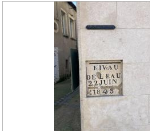
emplacement des repères