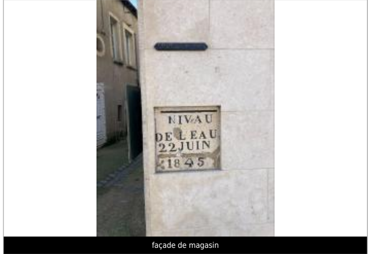
façade de magasin

MARQUE Texte : NIVeAU DE L'EAU 22 JUIN 1845 Maximum de l'inondation : Oui Visibilité : Oui État du repère : Bon Pérennité : Longue