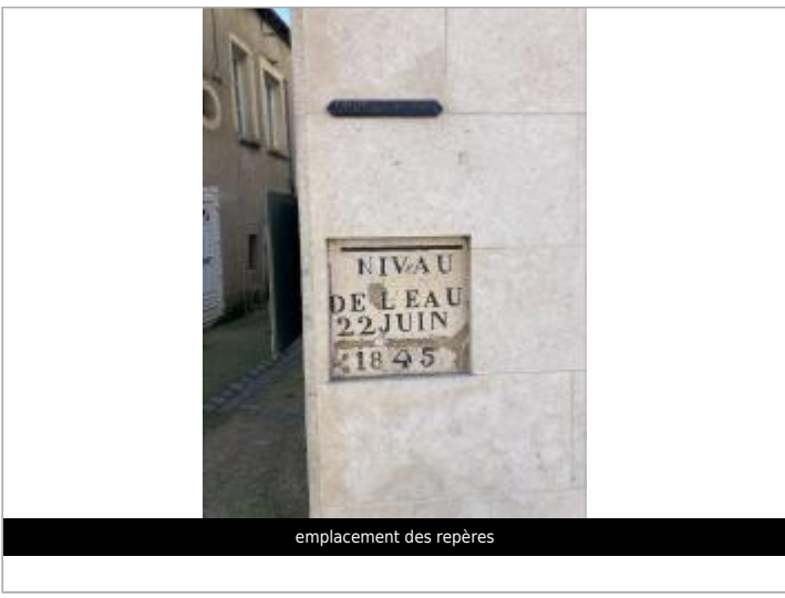
emplacement des repères

GÉOLOCALISATION Coordonnées WGS84 : X: 1.51857270 / Y: 46.58722300 Coordonnées RGF93 (Lambert 93) X: 586578.09 / Y: 6610750.67 Coordonnées RGF93 (ETRS89) : X: 1.5185727 / Y: 46.587223 Code Hydro: L---0070 Rive de référence: Droite