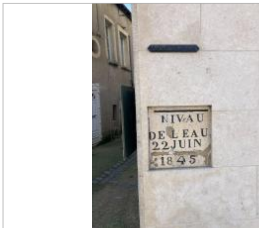
emplacement des repères