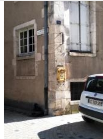
emplacement de la plaque