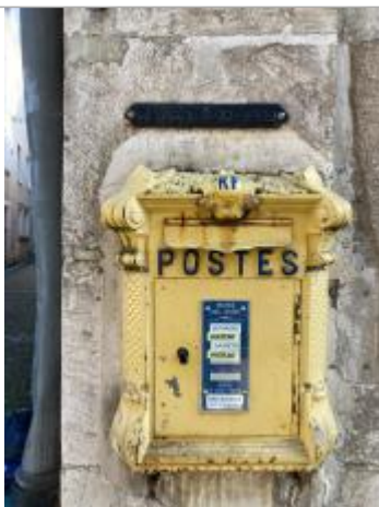
au dessus boîte aux lettres la poste

Organisme : SPC Vienne - Charente - Atlantique