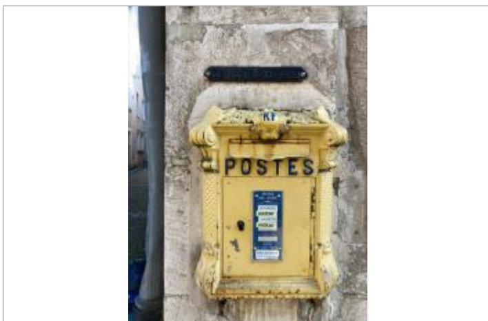
au dessus boîte aux lettres la poste

Organisme(s) : SPC Vienne - Charente - Atlantique