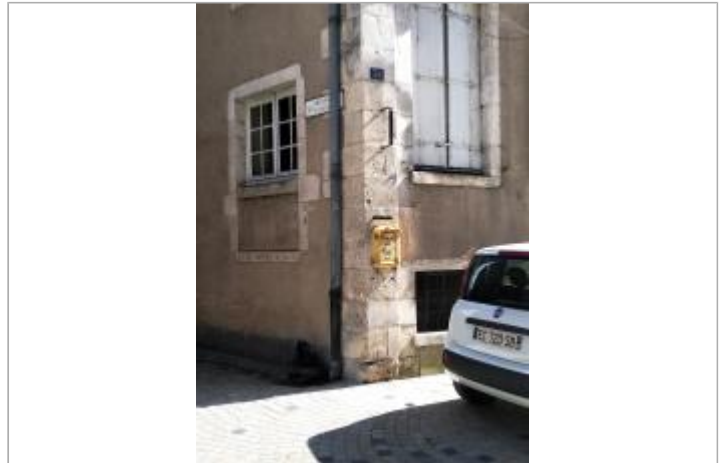
emplacement de la plaque