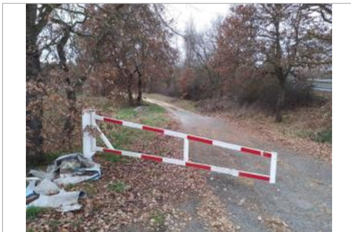
chemin d'accès au champs

GÉOLOCALISATION Coordonnées WGS84 : X: 1.55641660 / Y: 43.47934100 Coordonnées RGF93 (Lambert 93) X: 583164.37 / Y: 6265540.18 Coordonnées RGF93 (ETRS89) : X: 1.5564166 / Y: 43.479341 Code Hydro: O2--0250 Rive de référence: Gauche