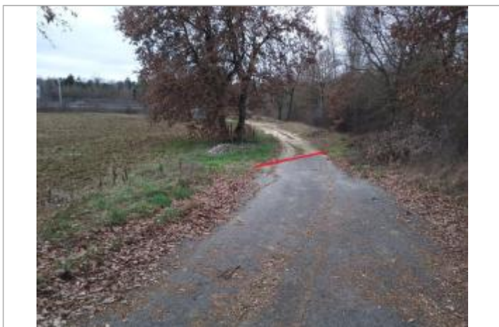
Traces de boues sur le chemin

NIVELLEMENT INITIAL - 19/01/2022 Méthode : GPS Référence nivelée : Marque d'inondation Description référence du repère : Laisse d'inondation au sol Système altimétrique : NGF IGN 1969 (système normal) Altitude de la référence (en m) : 152.290 m Différence entre le niveau d'eau et la référence (en m) : 0.000 m Altitude calculée de l'eau (en m) : 152.29 m