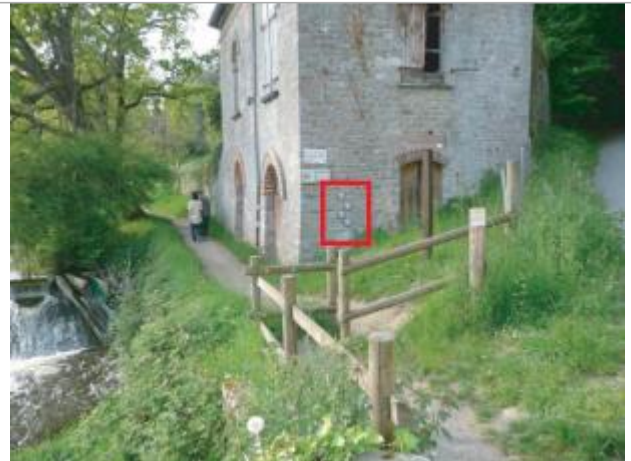
Maison individuelle, rue du moulin de la courbe