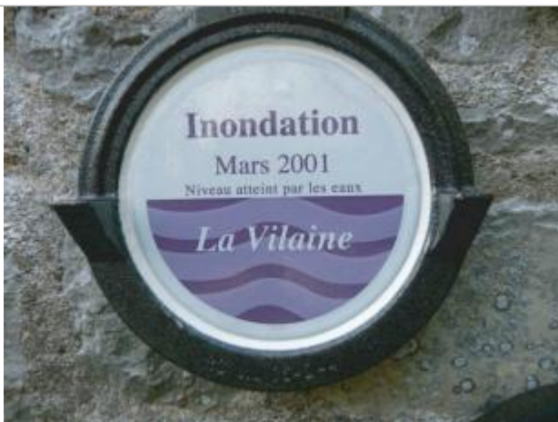
Repère normalisé de la crue de Mars 2001

Altitude calculée de l'eau (en m) : 13.87 m