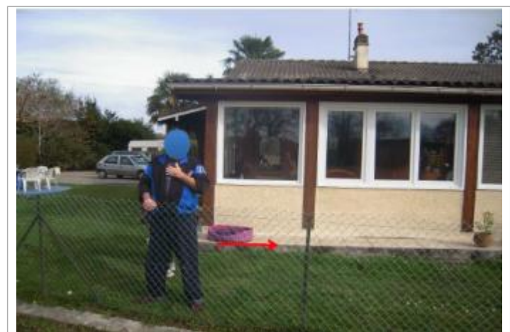
Vue du repère (la flèche rouge représente le niveau atteint par les eaux)