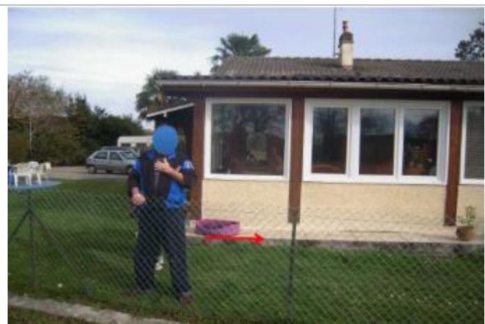
Vue du repère (la flèche rouge représente le niveau atteint par les eaux) - Auteur : HEA

Type de repérage : Campagne de terrain post-inondation