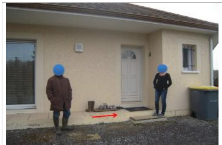
Vue du repère (la flèche rouge représente le niveau atteint par les eaux)

Type de repérage : Campagne de terrain post-inondation