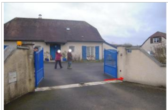
Vue du repère (la flèche rouge représente le niveau atteint par les eaux)

Maximum de l'inondation : Oui Visibilité : Non renseigné État du repère : Disparu Pérennité : Aucune Repère calculé : Non renseigné PHEC : Non renseigné