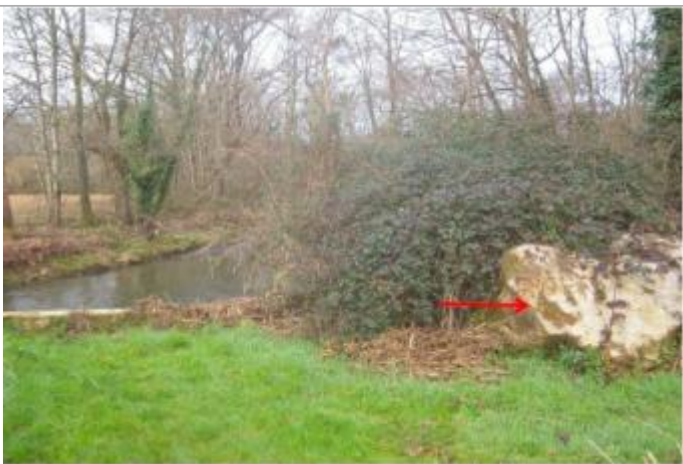
Vue du repère (la flèche rouge représente le niveau atteint par les eaux)

Altitude calculée de l'eau (en m) : 238.62 m