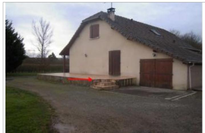
Vue du repère (la flèche rouge représente le niveau atteint par les eaux)