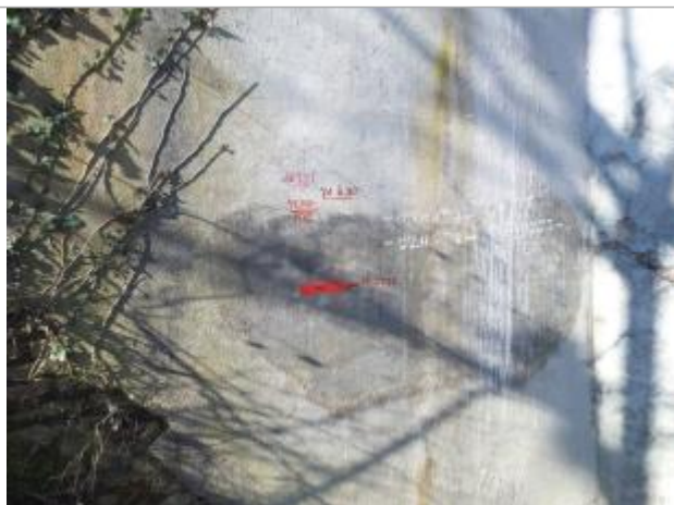
Marque de la crue