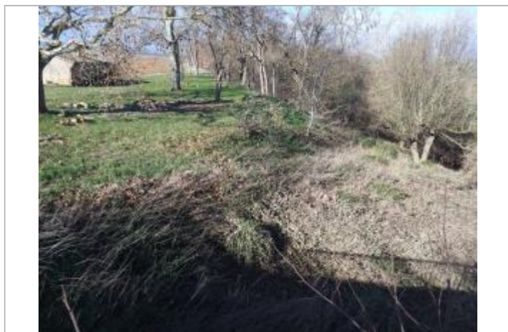
laisse de crue

Altitude calculée de l'eau (en m) : 166.73 m