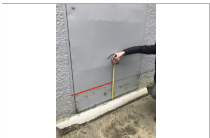
Vue du repère (le trait rouge représente le niveau atteint par les eaux)

GÉNÉRAL Code : WEB_R_202201193910 Date de mise à jour : 19/01/2022 Auteur : SMBGP