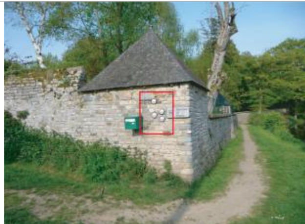
Maison particulière, Place de la Courbe