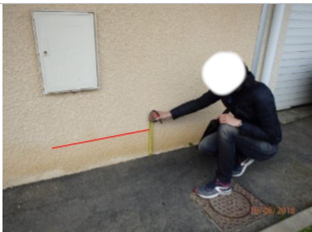
Vue du repère (le trait rouge représente le niveau atteint par les eaux)

Altitude calculée de l'eau (en m) : 101.97