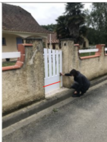
Vue du repère (le trait rouge représente le niveau atteint par les eaux) - Auteur : ARTELIA/DDTM 64

Altitude calculée de l'eau (en m) : 101.6 m