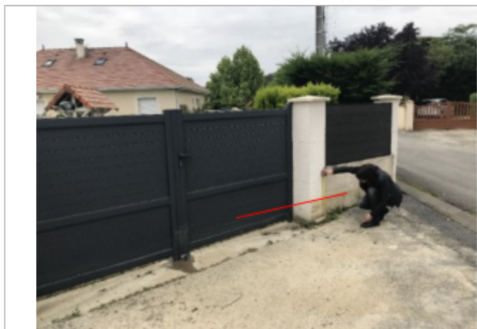
Vue du repère (le trait rouge représente le niveau atteint par les eaux) - Auteur : ARTELIA/DDTM

Code : WEB_R_202201181108 Date de mise à jour : 17/02/2022 Auteur : SMBGP