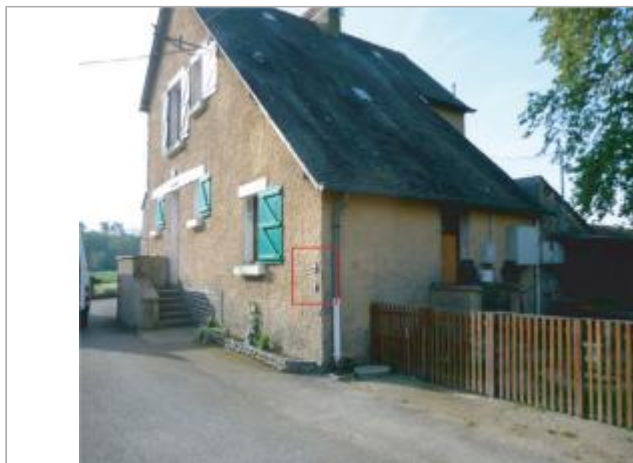
Maison éclusière, le Gai Lieu

Coordonnées WGS84 : X: -1.74941950 / Y: 47.92648800