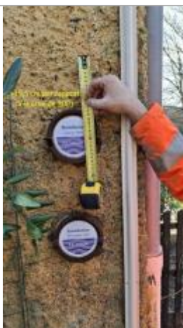
Différence entre la crue de 2025 et le repère de 2001

Altitude calculée de l'eau (en m) : 14.485