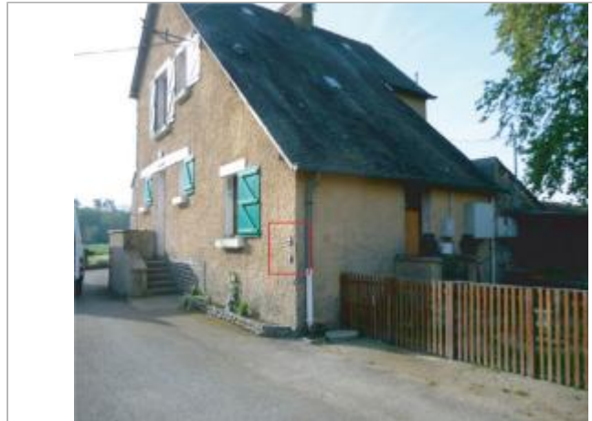
Maison éclusière, le Gai Lieu

Coordonnées WGS84 : X: -1.74941950 / Y: 47.92648800