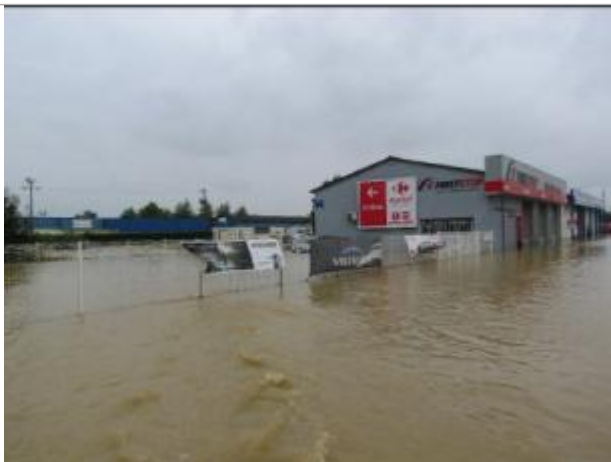
Vue du First Stop durant l'inondation - Auteur : ARTELIA/DDTM 64

Altitude calculée de l'eau (en m) : 103.25