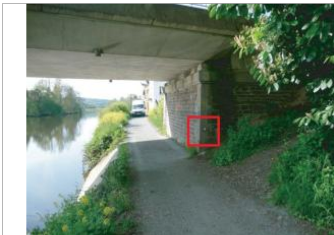
Pile du pont face amont

Coordonnées WGS84 : X: -1.74893490 / Y: 47.97196700