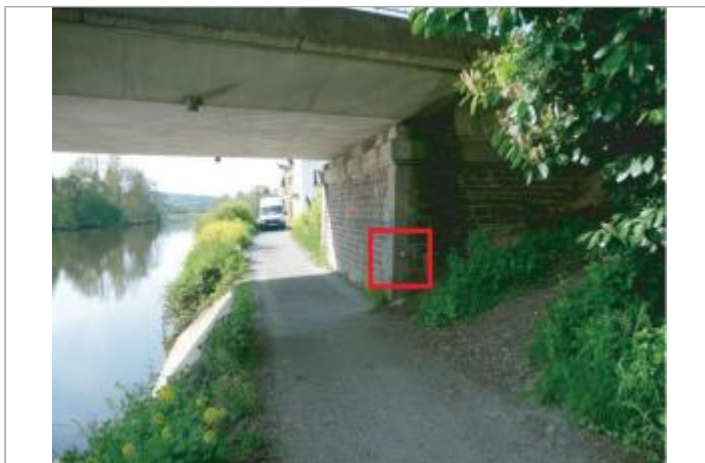
Pile du pont face amont