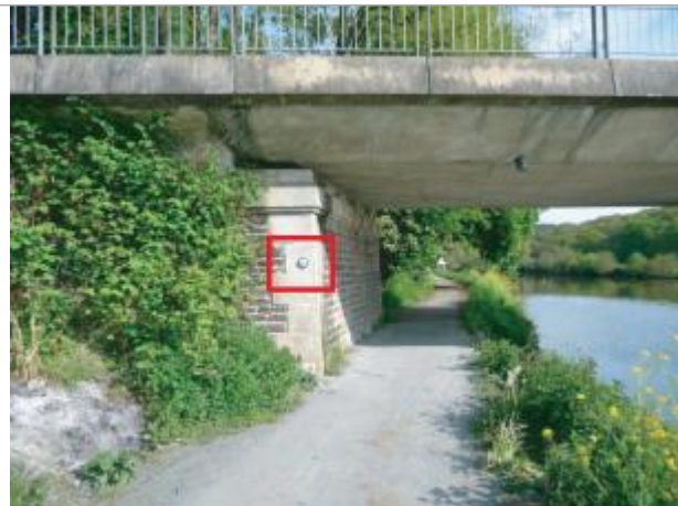
Pile du pont face aval

Coordonnées WGS84 : X: -1.74892720 / Y: 47.97190900