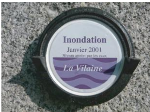
Repère normalisé de la crue de Janvier 2001

Altitude calculée de l'eau (en m) : 16.51 m