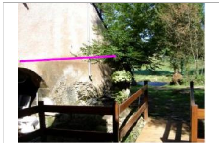
Vue du repère extérieur (le trait rose représente le niveau atteint par les eaux) - Auteur : Géodes

GÉNÉRAL ----- Code : WEB_R_202201185129 Date de mise à jour : 18/01/2022 Auteur : SMBGP