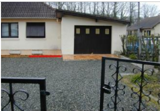
Vue du repère (le trait rouge représente le niveau atteint par les eaux)

Altitude calculée de l'eau (en m) : 109.46