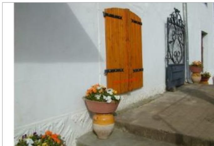
Vue du repère (le trait rouge représente le niveau atteint par les eaux) - Auteur : Géodes