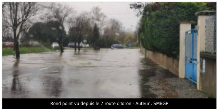
Rond point vu depuis le 7 route d'Itron - Auteur : SMBGP

GÉNÉRAL Code : WEB_R_202201180026 Date de mise à jour : 07/07/2022 Auteur : SMBGP