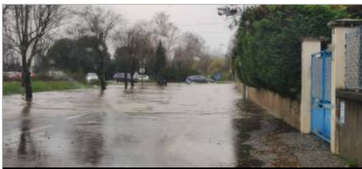
Rond point vu depuis le 7 route d'Idron - Auteur : SMBGP