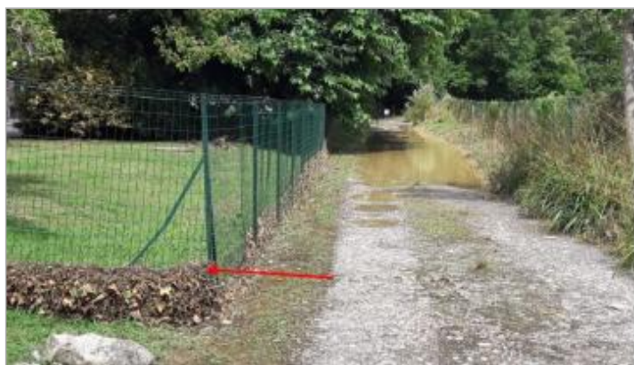
Vue du repère (la flèche rouge représente le niveau atteint par les eaux)