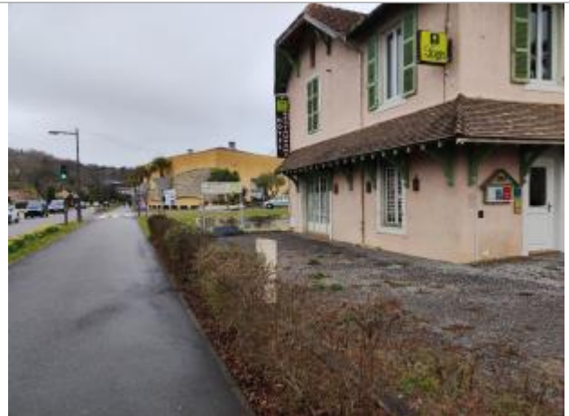
Vue du site depuis la piste cyclable