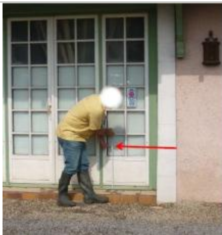
Vue du repère (la flèche rouge représente le niveau atteint par les eaux)