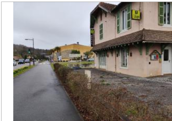
Vue du site depuis la piste cyclable - Auteur : SMBGP