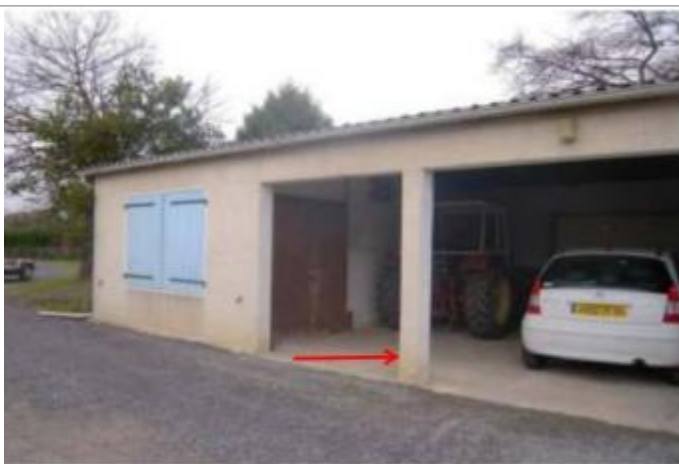
Vue du repère (la flèche rouge représente le niveau atteint par les eaux)

Altitude calculée de l'eau (en m) : 201.24 m