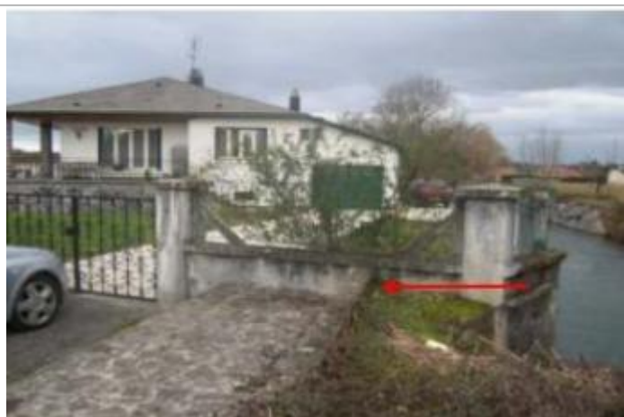
Vue du repère (la flèche rouge représente le niveau atteint par les eaux)

Altitude calculée de l'eau (en m) : 208.67