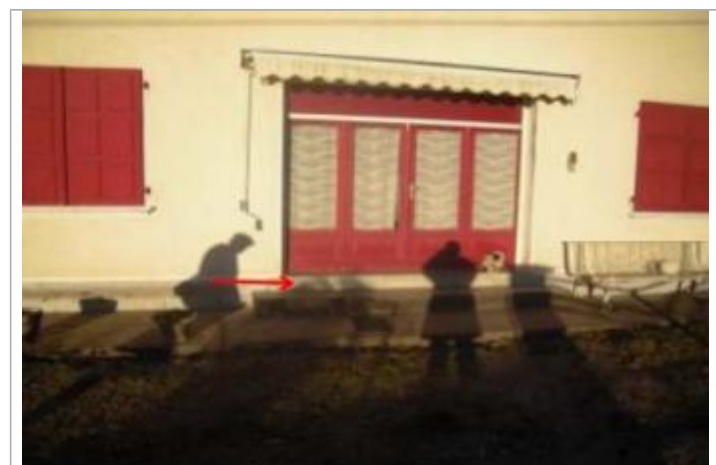
Vue du repère coté rue (la flèche rouge représente le niveau atteint par les eaux) - Auteur : HEA