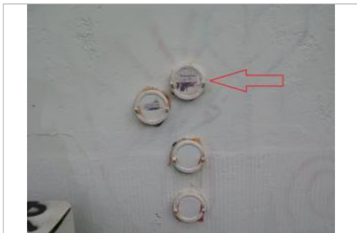
Repère normalisé de la crue de Mai 1981

Altitude calculée de l'eau (en m) : 27.98 m