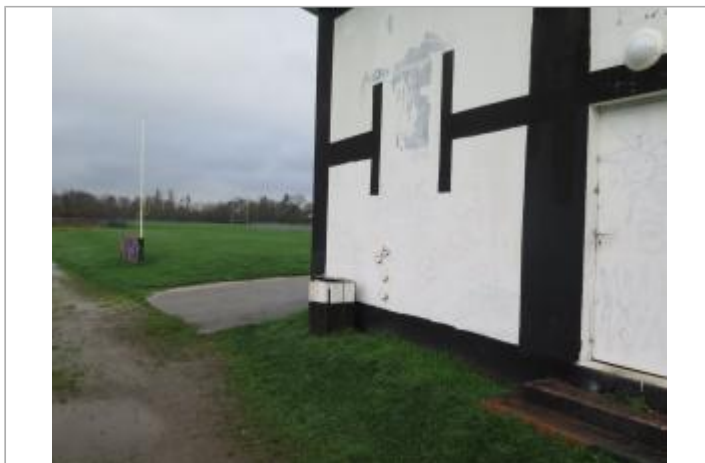
Arrière des tribunes du stade de Bellangerais