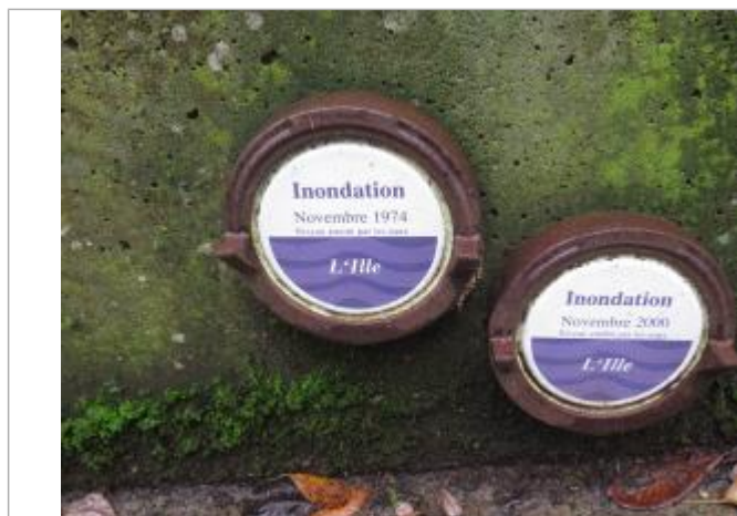
Allée Alfred Jarry, au niveau d'une cale de mise à l'eau

Altitude calculée de l'eau (en m) : 25.05