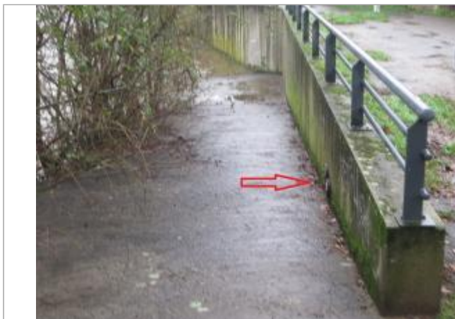
Allée Alfred Jarry, au niveau d'une cale de mise à l'eau