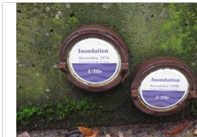
Allée Alfred Jarry, au niveau d'une cale de mise à l'eau

Altitude calculée de l'eau (en m) : 24.98