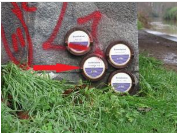
Repère normalisé de la crue de Décembre 1999

Altitude calculée de l'eau (en m) : 25.53 m