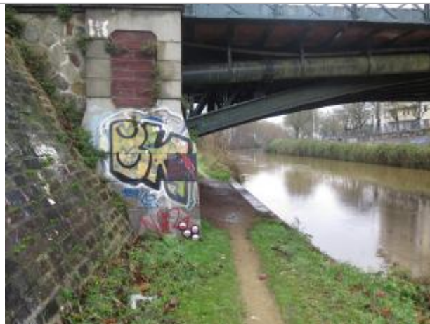
Pont Legraverend, rive droite