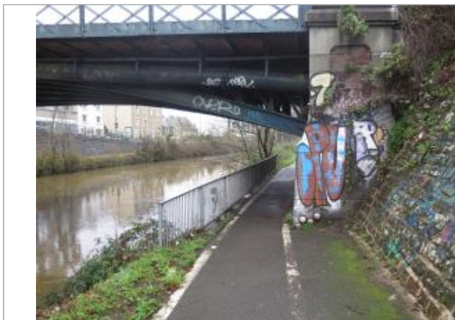
Pont Legraverend, rive gauche