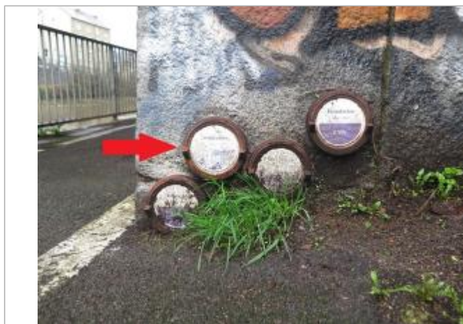
Pont Legraverend, rive gauche