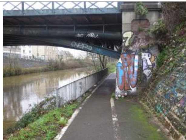
Pont Legraverend, rive gauche