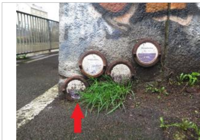
Pont Legraverend, rive gauche