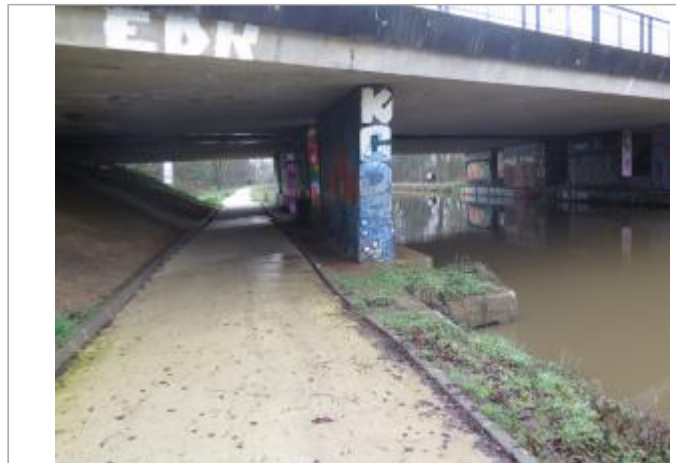
Pont du boulevard d'armorique, rive droite

Coordonnées WGS84 : X: -1.67983540 / Y: 48.12919500