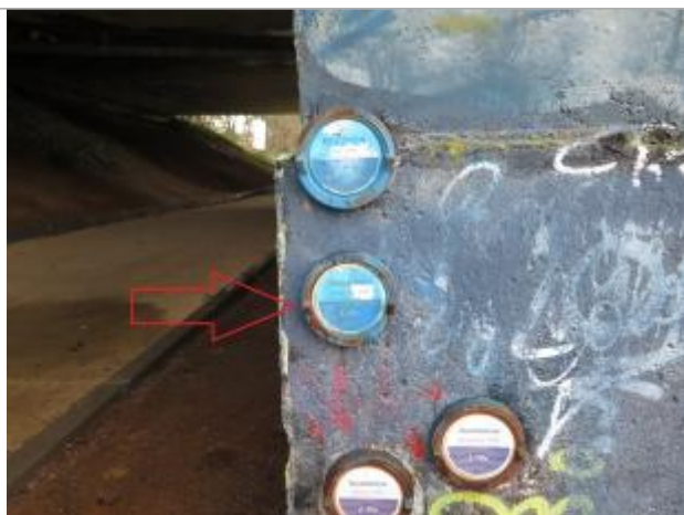
Pont du boulevard d'armorique, rive droite

Altitude calculée de l'eau (en m) : 27.67