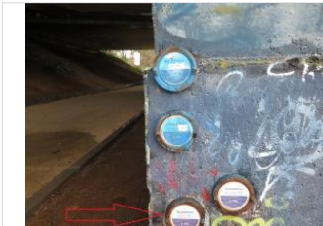
Repère normalisé de la crue de Janvier 1995

Altitude calculée de l'eau (en m) : 27.36