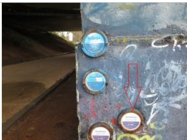
Pont du boulevard d'armorique, rive droite

Altitude calculée de l'eau (en m) : 27.45