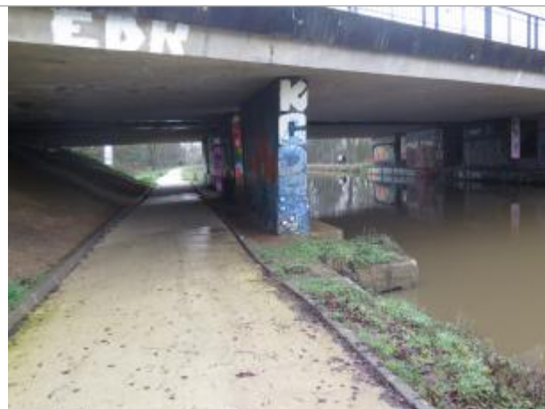
Pont du boulevard d'armorique, rive droite

Coordonnées WGS84 : X: -1.67983540 / Y: 48.12919500