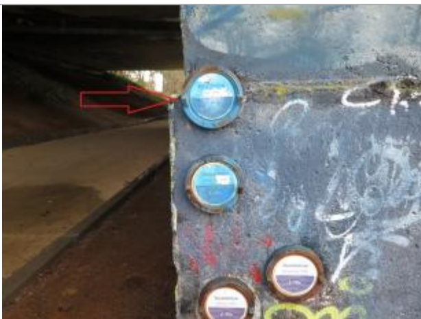
Pont du boulevard d'armorique, rive droite

Altitude calculée de l'eau (en m) : 27.88