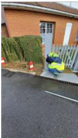
Dépôts de débris végétaux le long de la haie à 40 cm/sol.

Altitude calculée de l'eau (en m) : 26.131 m