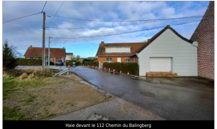
Haie devant le 112 Chemin du Balingberg

Coordonnées WGS84 : X: 2.39217320 / Y: 50.80616900