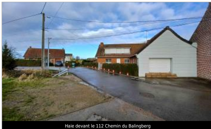
Haie devant le 112 Chemin du Balingberg

GÉOLOCALISATION Coordonnées WGS84 : X: 2.39217320 / Y: 50.80616900 Coordonnées RGF93 (Lambert 93) X: 657072.42 / Y: 7079022.42 Coordonnées RGF93 (ETRS89) : X: 2.3921732 / Y: 50.806169 Code Hydro: E4900720 Rive de référence: Droite