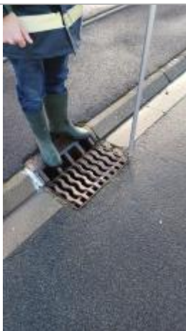
Dépôt de débris de végétation au niveau de la grille d'évacuation.

Altitude calculée de l'eau (en m) : 21.428 m