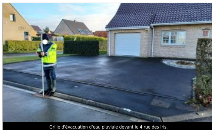
Grille d'évacuation d'eau pluviale devant le 4 rue des Iris.

GÉOLOCALISATION Coordonnées WGS84 : X: 2.41225510 / Y: 50.83523500 Coordonnées RGF93 (Lambert 93) X: 658514.79 / Y: 7082251.32 Coordonnées RGF93 (ETRS89) : X: 2.4122551 / Y: 50.835235 Code Hydro: E4900740 Rive de référence: Droite