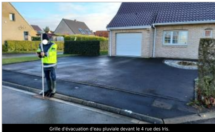
Grille d'évacuation d'eau pluviale devant le 4 rue des Iris.