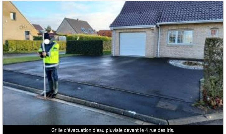
Grille d'évacuation d'eau pluviale devant le 4 rue des Iris.