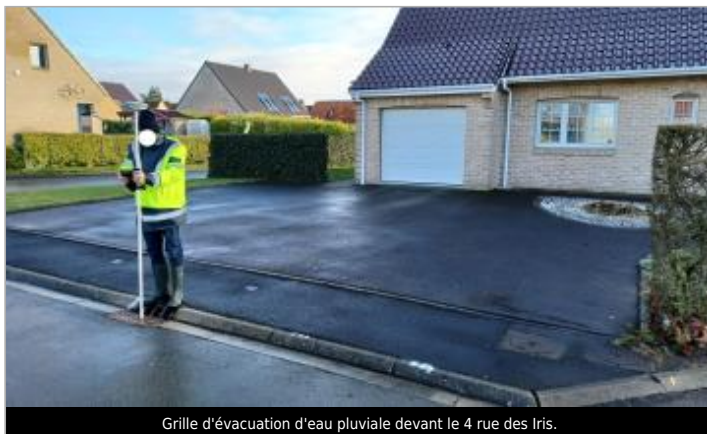
Grille d'évacuation d'eau pluviale devant le 4 rue des Iris.